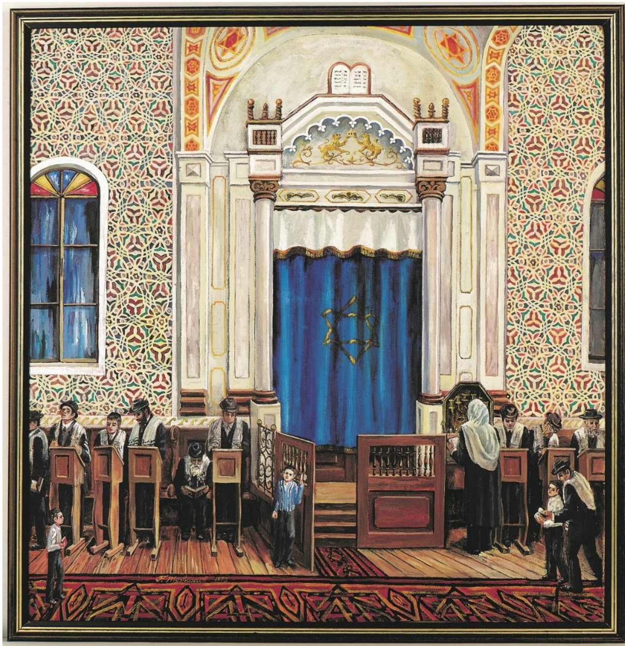
בית הכנסת בחוסט