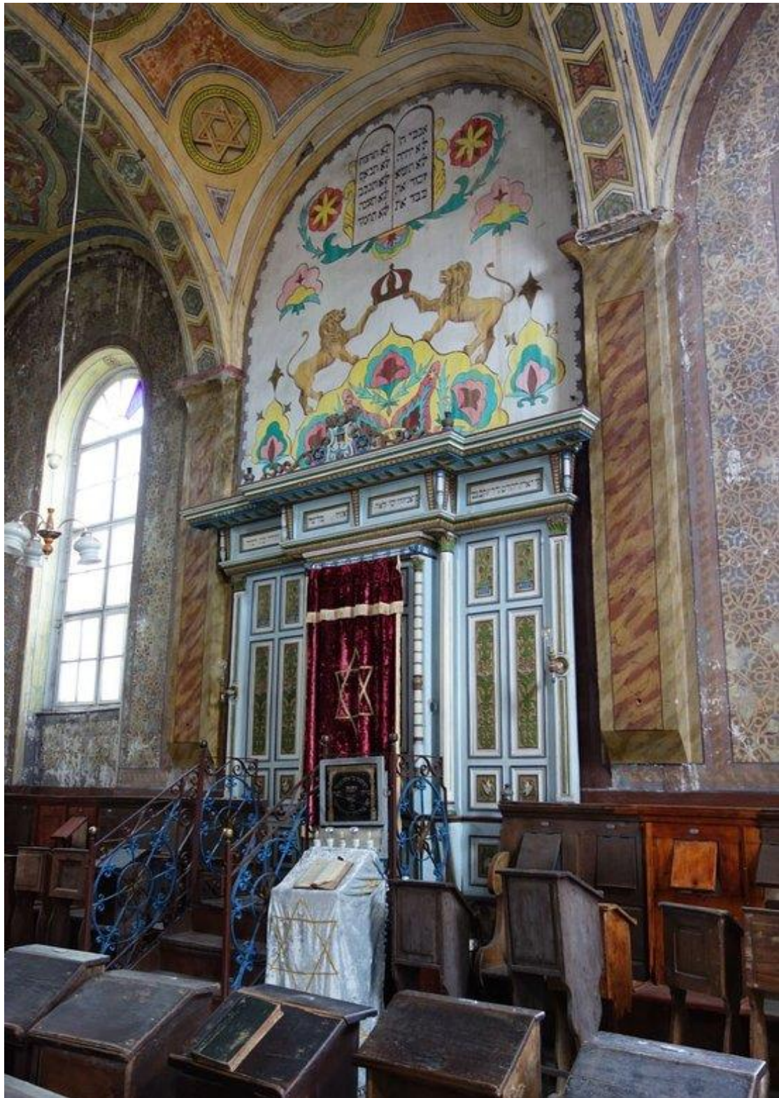
צילום קיר מעל ארון קודש בבת הכנסת בחוסט ב-1974 (צילום)