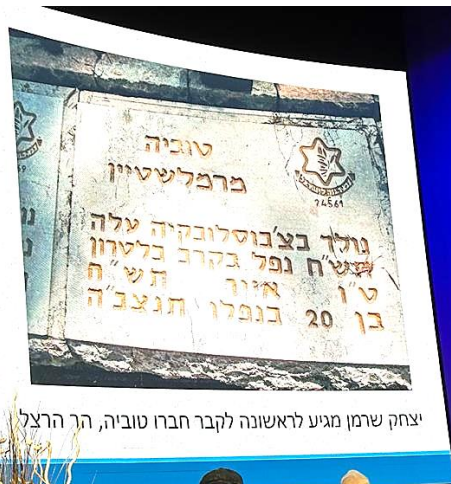
יצחק שרמן מגיע לראשונה לקבר חברו טוביה, הר הרצל