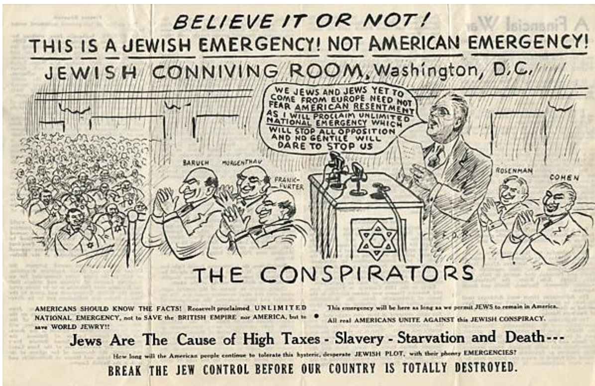
קריקטורות אנטישמיות בארה"ב