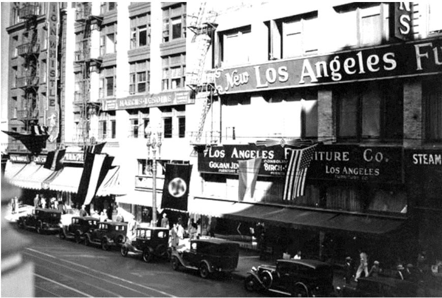
צלב קרס על בניין בלוס אנג'לס