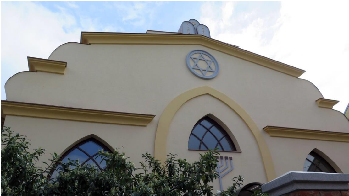
המרכז הקהילתי במרכז ברגסס; בעבר בית הכנסת הגדול, שנהפך בתקופה הסובייטית למתנ"ס. מאחורי לוחות האבן החיצוניים נחבאת האדריכלות המדהימה של המבנה המקורי