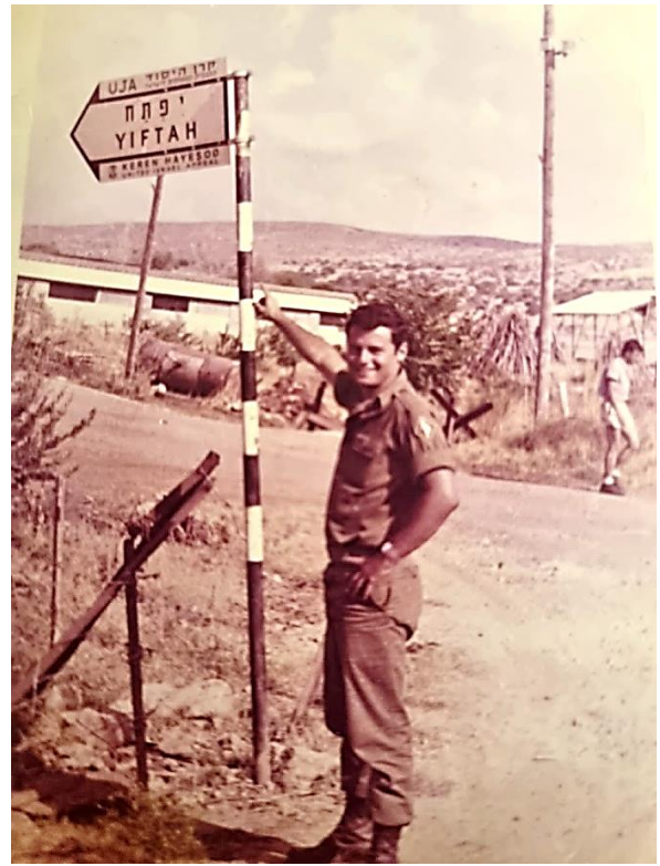
קיבוץ יפתח, 1966