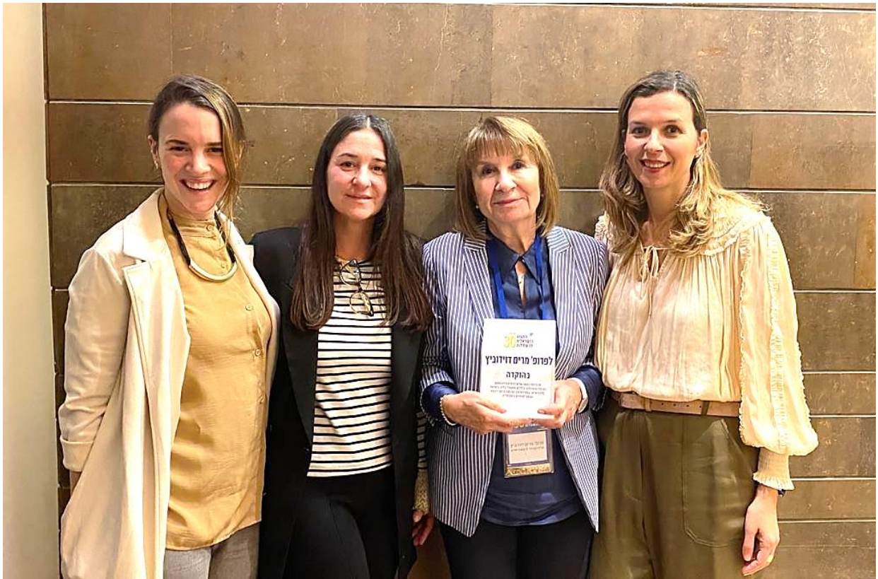
מרים עם בנותיה ועם נכדיה