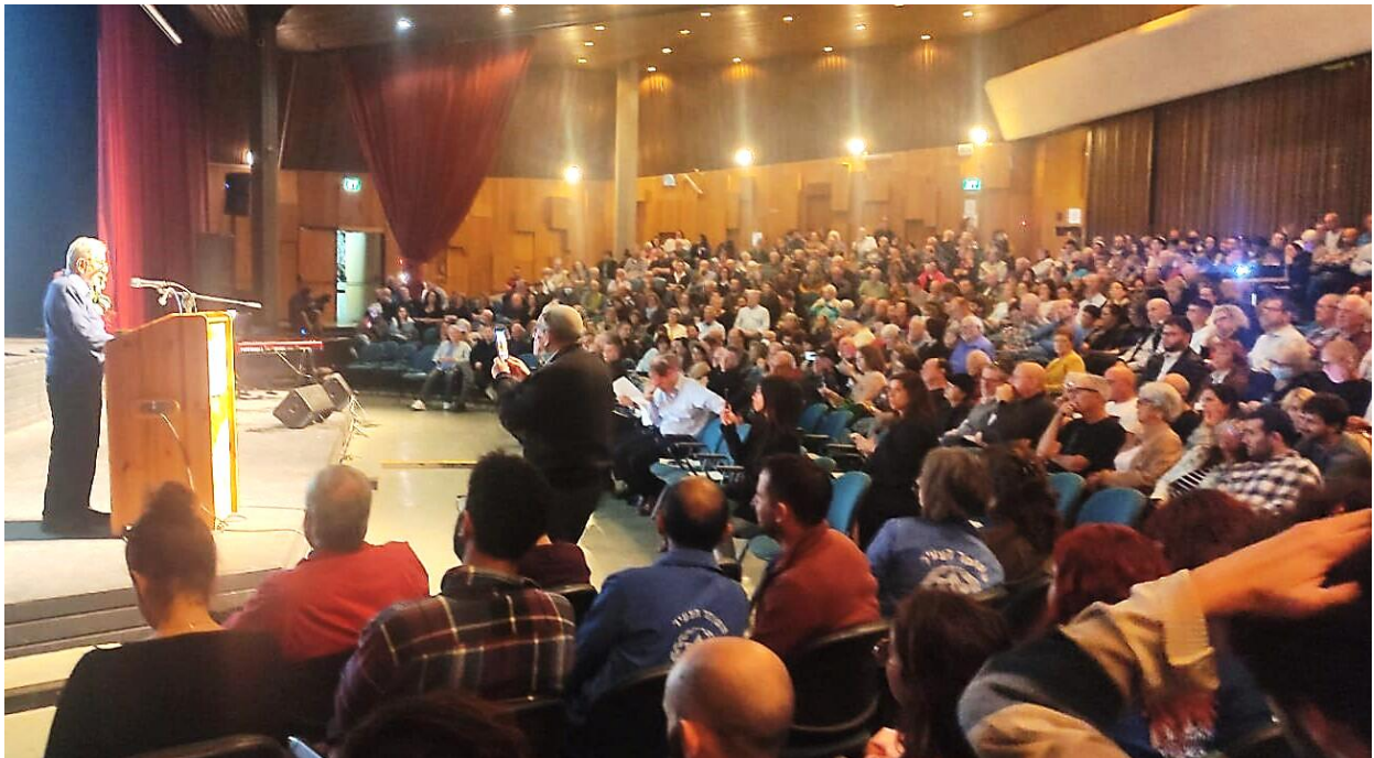
טקס הענקת "אות המציל היהודי" בקיבוץ הזורע

לצד הסיוע בהצלת חיי יהודים, המחתרת סייעה גם בלחימה נגד הנאצים ובקיום חיים יהודיים. "הפצנו תעודות שוויצריות בעשרות אלפים לכל דורש. הפצנו מזון, אמצעי חימום וכסף ובתי הילדים, לבתים המוגנים, לבית הזכוכית ולגטו הגדול בבודפשט. שיתפנו גם פעולה וסייענו להתארגנויות האנטי נאציות המקומיות הלא יהודיות. היינו המחתרת היחידה בכל אירופה הכבושה, שבה התאחדו כל תנועות הנוער הציוניות". גור מציין את פועלה של העמותה לחקר תנועות הנוער הציוניות בהונגריה, הפועלת להנצחת המחתרת ולהנגשת החומרים ההיסטוריים אודותיה באתר האינטרנט שלה. [היכנסו לשני הקישורים "הכחולים"]