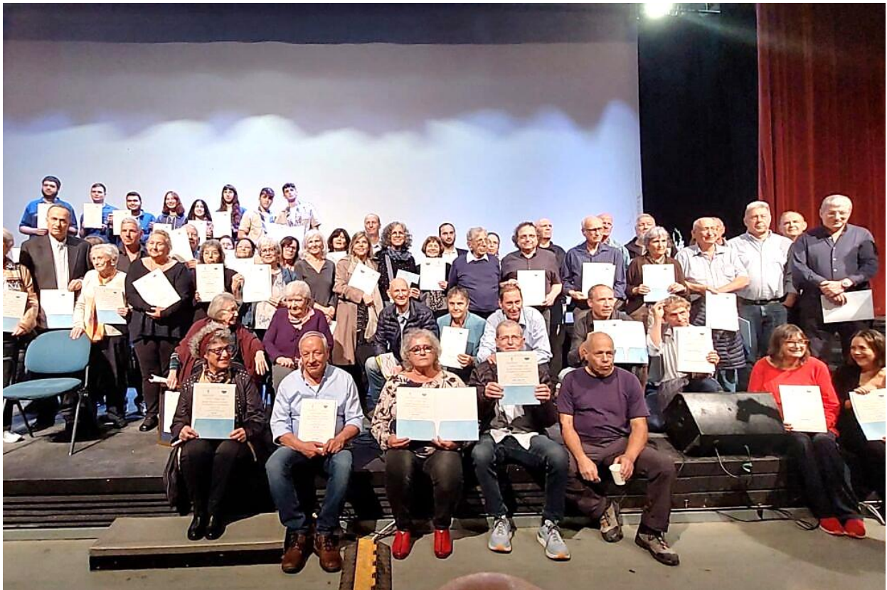
חברי המחתרת ומשפחות חברי המחתרת שקיבלו את האות בשמם

https://www.davar1.co.il/411790/?fbclid=IwAR0a4BPS02fskjjJ5B9ZzCi-ag6ANpYvLVfDDirTYRiHEaau7DISJAD8BIU