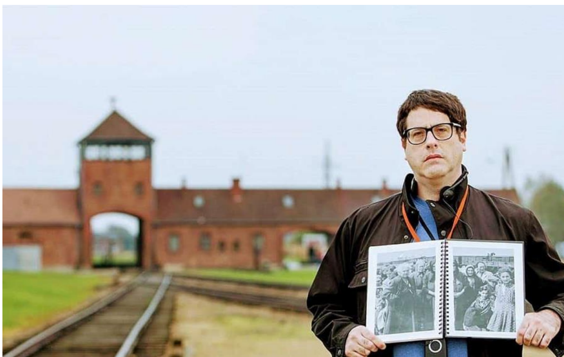
מאת מאט ליבוביץ'

בבירקנאו, אבל עכשיו זיהיתי את עצמי בעיניה"