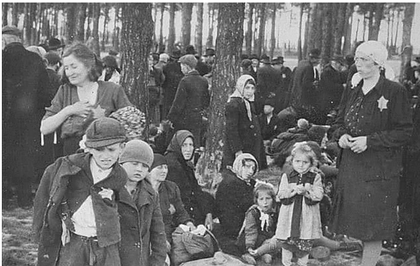
יהודים הונגרים ממתינים ל"מקלחות" בחורשה של אושוויץ-בירקנאו, מאי 1944, חלק מ"אלבום אושוויץ"