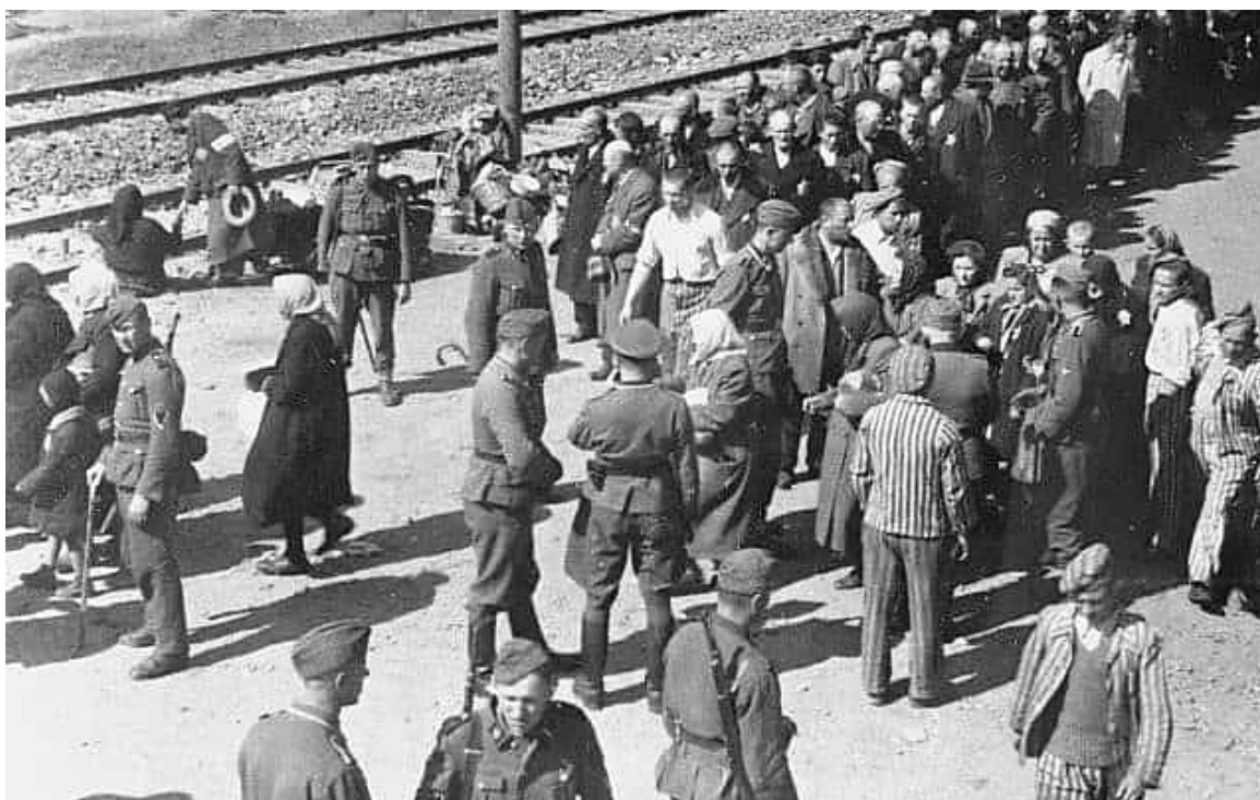
אחת מתמונות "אלבום אושוויץ" שצולמה מגג קרון משא ב-1944. כמה מקציני האס-אס ומהקרבתנות זוהו

האלבום, שערך באופן כרונולוגי, מתחיל בקורבנות היורדים מקרונות המשא. הוא מסתיים ב"חורשה", שבה יהודים שנשלחו למוות – בעיקר ילדים וזקנים – המתינו בין עצי הלבנה. התמונות מהחורשה תויגו כ"גופות שאינם כשירים עוד."