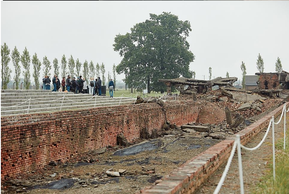
על חורבות הקרמטוריום