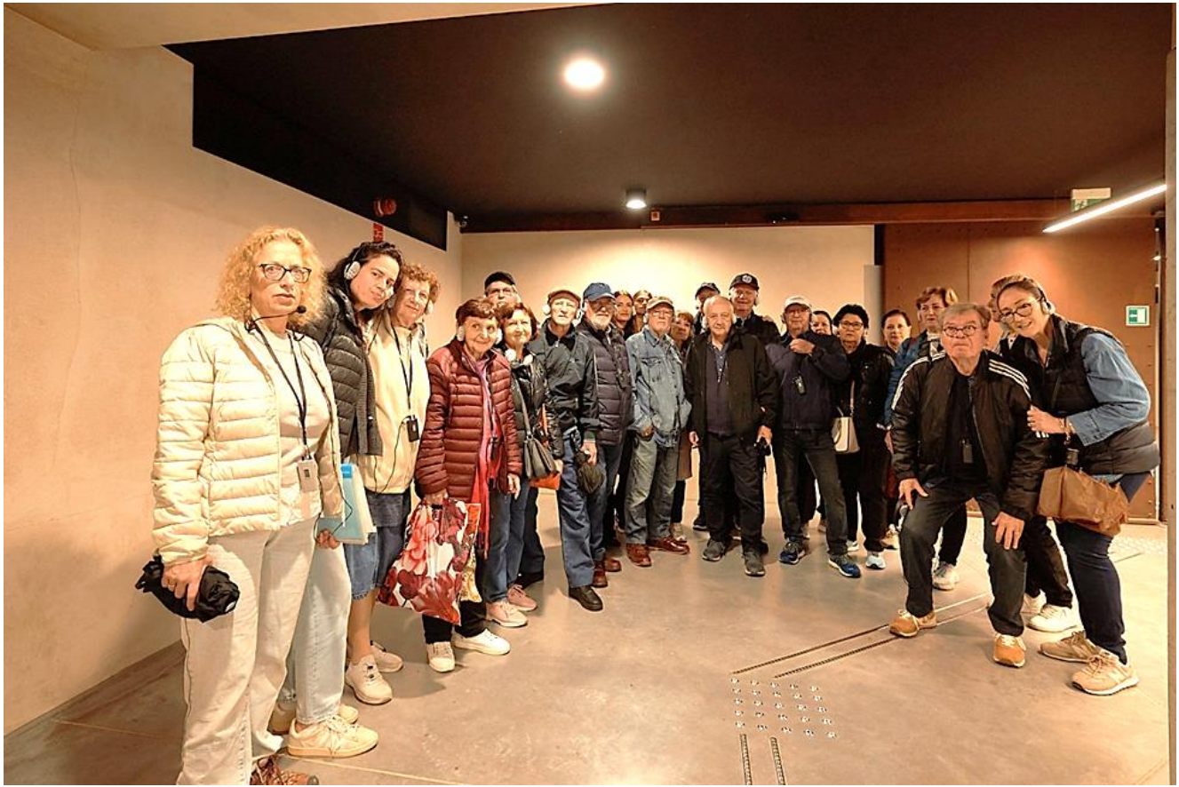
הסיור באושוויץ 1 - ספר השמות של הנרצחים בשואה