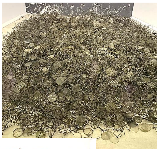
ערמות משקפיים, נעליים, מזוודות