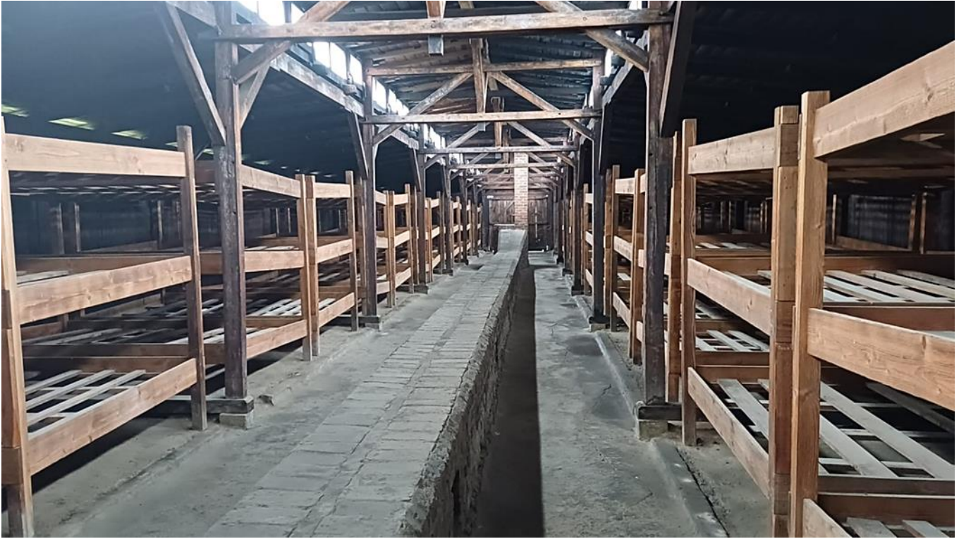
בלוק "המגורים" וה"שירותים"