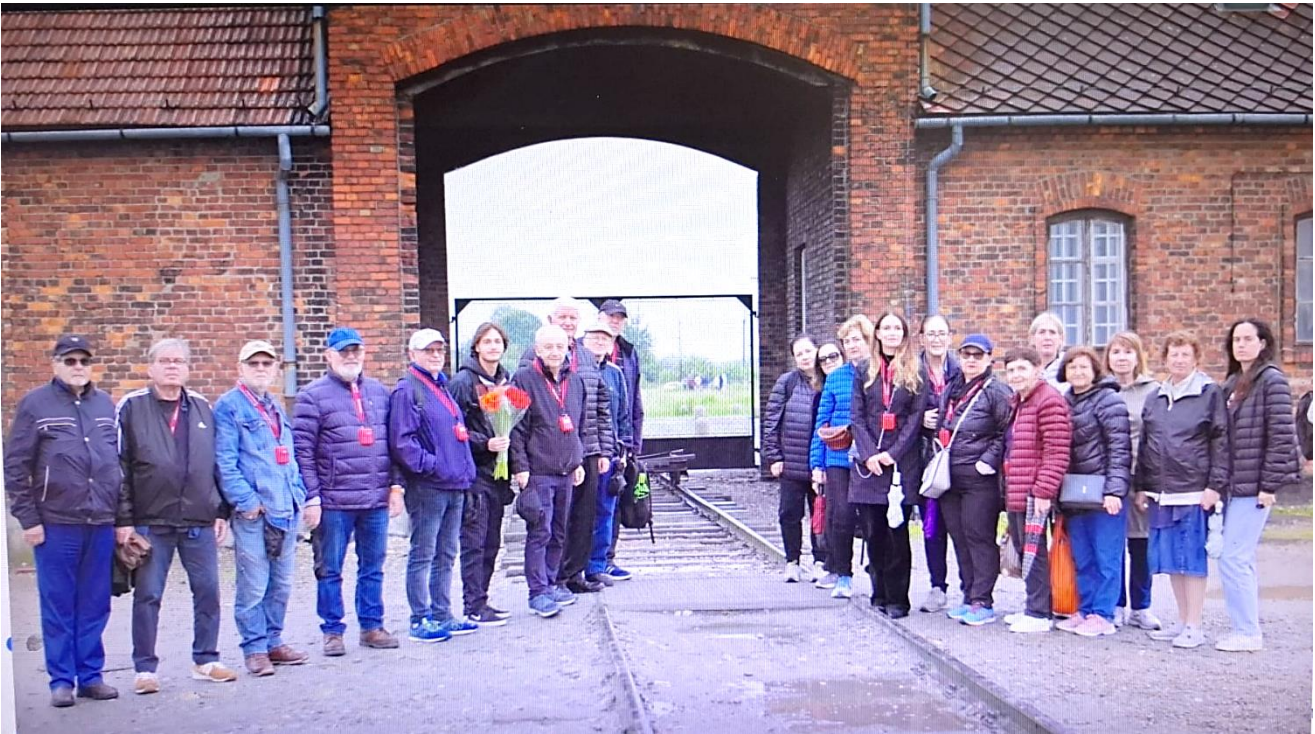
הכניסה לאושוויץ 2 - בירקנאו