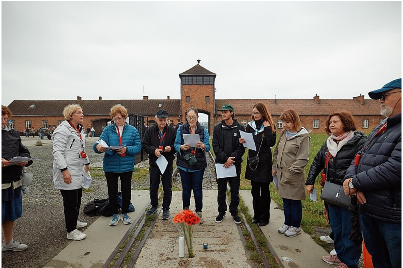
בירקנאו - טקס לזכר בני המשפחות שלנו