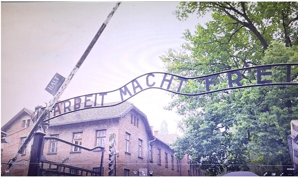
הכניסה לאושוויץ 1