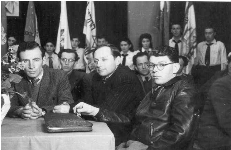
מונצל' (מימין) בכינוס המפלגה בגרמניה, 1947