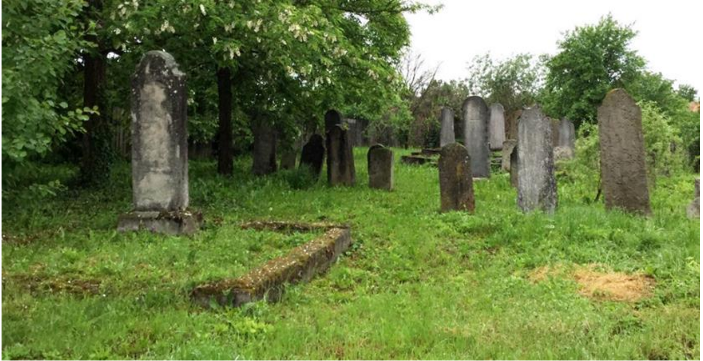
בית הקברות בבטיובו