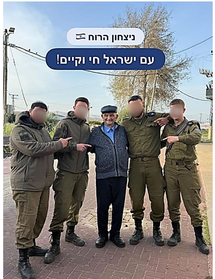
אביגדור עם חיילי צה"ל