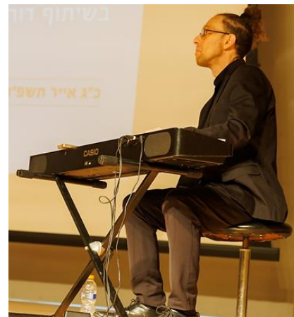
מתוך סרט התדמית של העמותה [יועלה בהמשך לאתר העמותה]